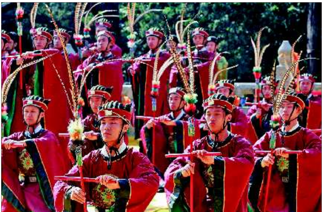
9月28日,在曲阜上演了一场华丽的祭孔大典。