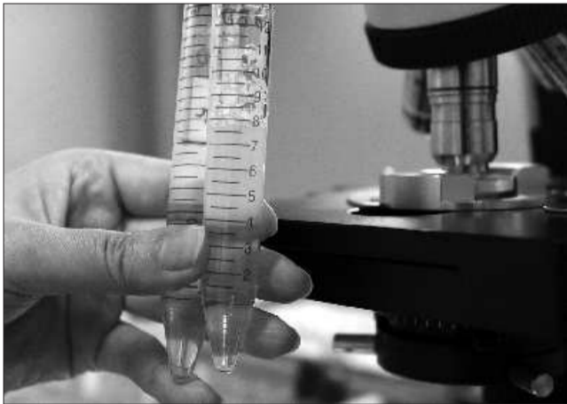
医务人员对精液进行分析提纯。