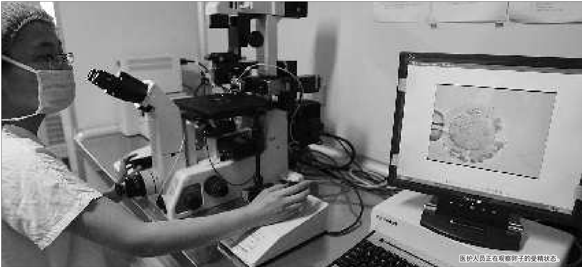
医护人员正在观察卵子的受精状态。