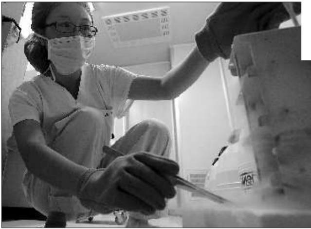
在-197℃的精子库中取出精子。