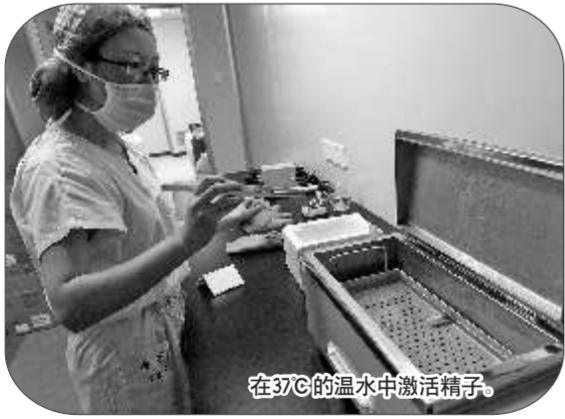
在37℃的温水中激活精子。