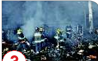
棉花纺织厂车间被烧。