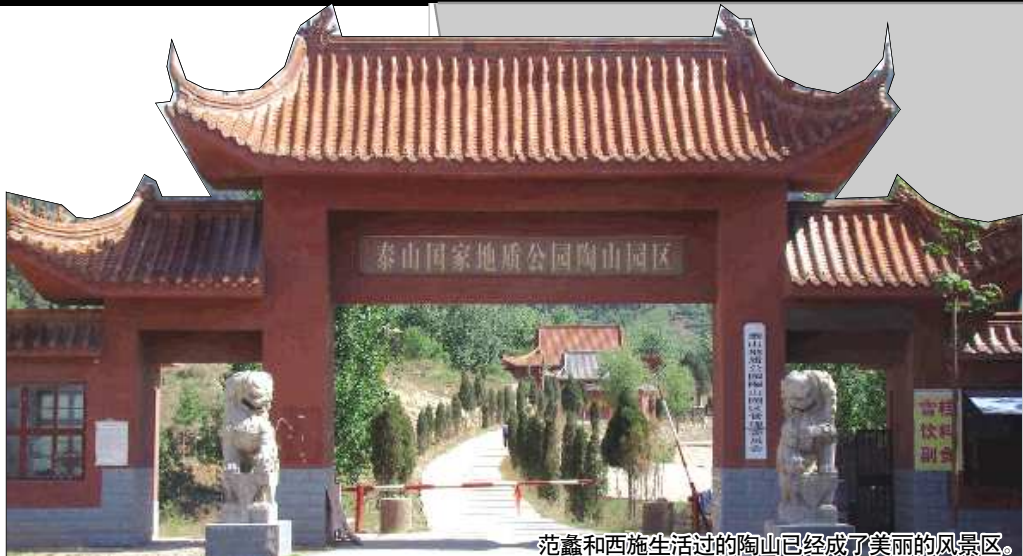
范蠡和西施生活过的陶山已经成了美丽的风景区。