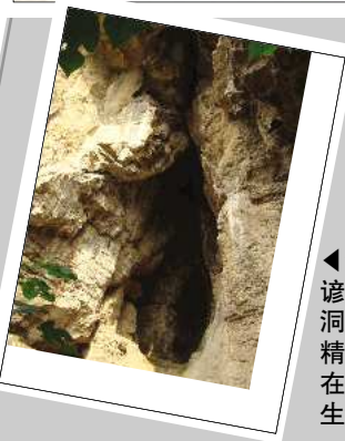
▲湖屯当地有句谚语:“陶山72洞,洞洞有妖精。”西施也曾经在这样一个洞中生活过。