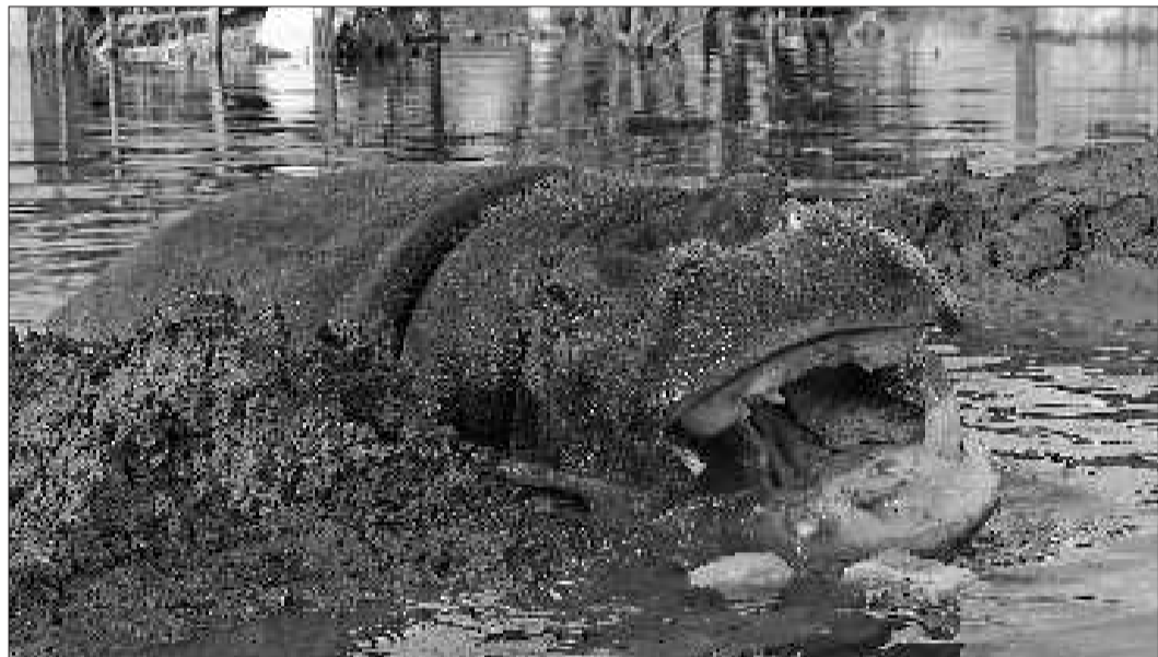
12月6日,在黑山的普拉夫尼察,河马妮基察在洪水中游泳。