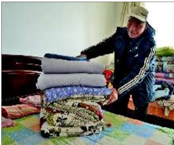
没有暖气,居民晚上要盖上三层被子

马明给记者拿出了一份五柳庄花园6号楼(房屋户(室)面积对照表)。“这栋楼的总建筑面积达到了5840.76平方米,每平