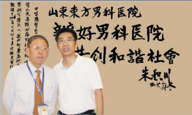
2006年底，中国泌尿男科领军人、北京医科大学人民医院泌尿科主任、博士生导师朱积川教授为山东东方男科医院题词：“办好男科医院，共创和谐社会”。

医院汇集了48位医术精湛，博学多识的全国泰斗级男科专家亲自诊疗，采用独具特色的172种国际前沿新技术以及369套国内顶尖设备，专业专科，专病专治，规范诊疗，以数十万例男科患者的康复病例保障见证了医院从先行者到领导者的成功飞跃。