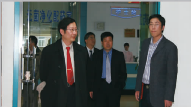
2010年3月，海峡两岸男科学高峰论坛闭幕后，中国台北男科专家代表团一行来到山东东方男科医院参观、交流工作。