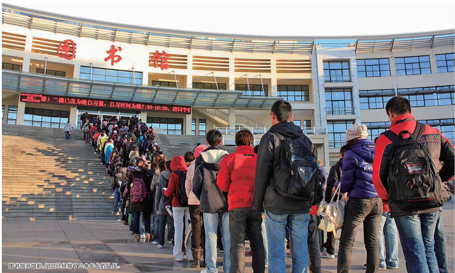
图书馆开馆前,门口已经排了几条长长的队伍。