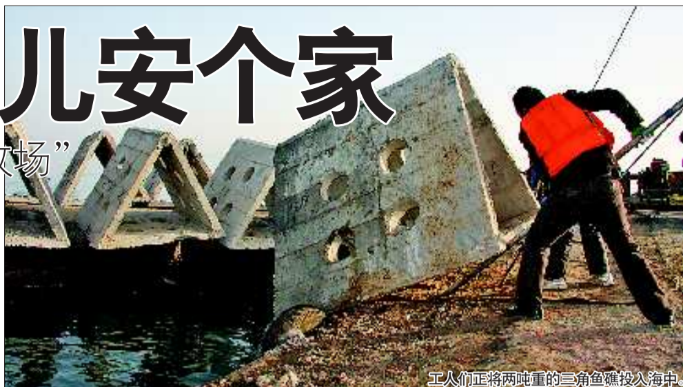
工人们正将两吨重的三角鱼礁投入海中。

日照一处投资2400万元的人工鱼礁建设项目将于本月底完成。届时,东港区黄家塘湾海域将建成30个混合单位鱼礁,形成鱼礁规模15.5万空方,为这一带的海洋生物建造“新家园”。三至五年后,预计实现经济效益突破1000万元。