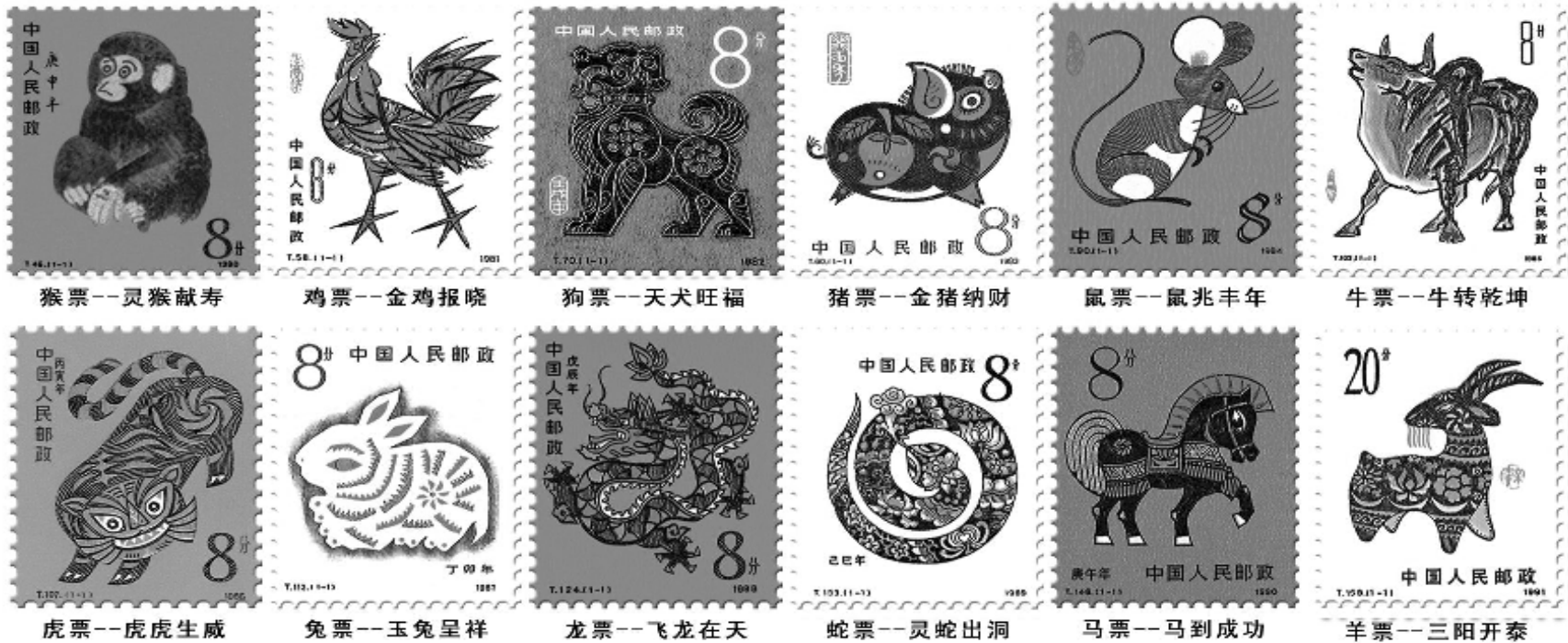
▲2011年新年日渐临近,中国集邮总公司,破例将首轮十二生肖邮票铸造成12枚“国瓷生肖邮票”,以12个生肖的12个寓意祝福我们在玉兔年里,岁岁平安、年年幸福、人人康泰、事事随心。

罕见魄力!打破30年来只发行单枚纸质生肖邮票的惯例,破例发行第一套《国瓷十二生肖邮票》。