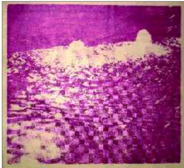
《北洋画报》刊登的济南趵突泉。