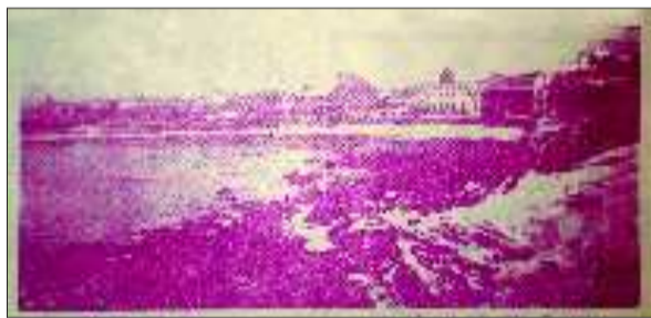
《北洋画报》刊登的烟台雪景。

年15岁时即于南京挑班演出，极受赞誉。1927年北上京，居住于宣武区棉花头条。她青衣、花旦、刀马旦皆精，能演梅派的《嫦娥奔月》、《廉锦枫》等，尚派的《秦良玉》，荀派的《盘丝洞》、《英杰烈》，并能兼演小生戏《水淹下邳》、《白门楼》等，尤其《花木兰》、《再生缘》（即《孟丽君》），又名《华丽缘》中女扮男装极见光彩。她在北京“城南游艺园”日夜演出，有时一个月内竟演出40多场。