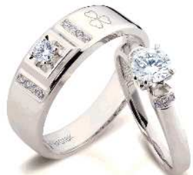
“穿越时空的爱同还对戒”

二月、三月，是明星扎堆活动的月份。从柏林电影节到奥斯卡，众多明星穿着精美礼服、戴着璀璨珠宝，在红毯上款款而行，让观众大饱眼福。三月，还有一个女性的节日，就是“国际劳动妇女节”，对于现代时尚女性来说，她们更喜欢把3月8日称为“女人节”。