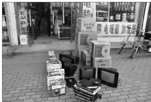
民警从某百货小家电市场搜查出的假冒名牌商标的电视机。

民警提醒广大市民,购买选择电视时,要选择正规的电视销售点进行选购。如果市民在选购电视时,发现有假冒伪劣行为时,请及时向相关部门举报,也可以拨打110报警。