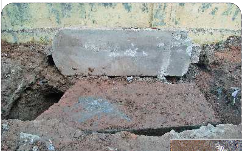
▲两块石碑的发掘现场。

针对这一现实情况,消协把两位购房者和售楼处经理召集到消协办公室进行了认真的调解。起初三方各持己见,意见不合,互不让步。最后消协拿出调解建议:让后办理定房确认单的刘先生在小区内再选一套同价位的房子,售楼方让利10000元,最后售楼处采纳了消协的建议,两位消费者也表示满意。