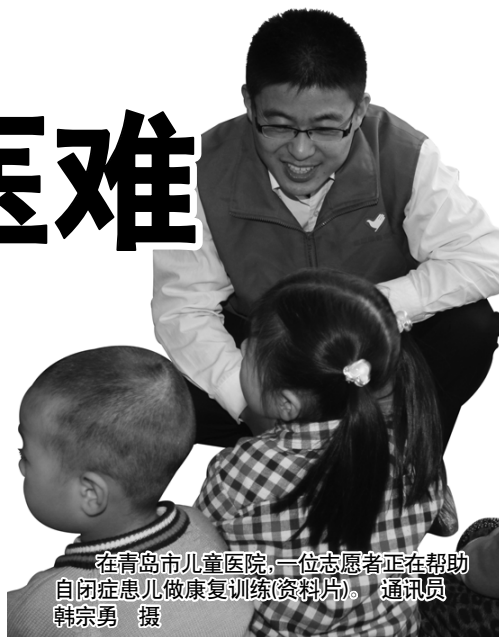
在青岛市儿童医院,一位志愿者正在帮助自闭症患儿做康复训练(资料片)。

预约报名的患儿人数达到1000多人,今年报名,明年才能参加康复治疗。随着自闭症患儿人数的日益增多,在青岛一些自闭症康复机构,患儿就医遭遇难题:治疗机构少,专业特教教师人手少是主要原因。