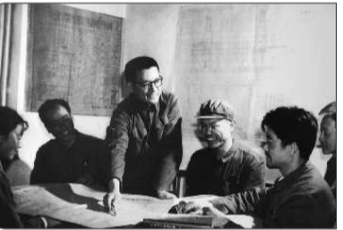
1975年,设计人员经过半年时间完成了胜利一号钻井平台的技术设计任务。