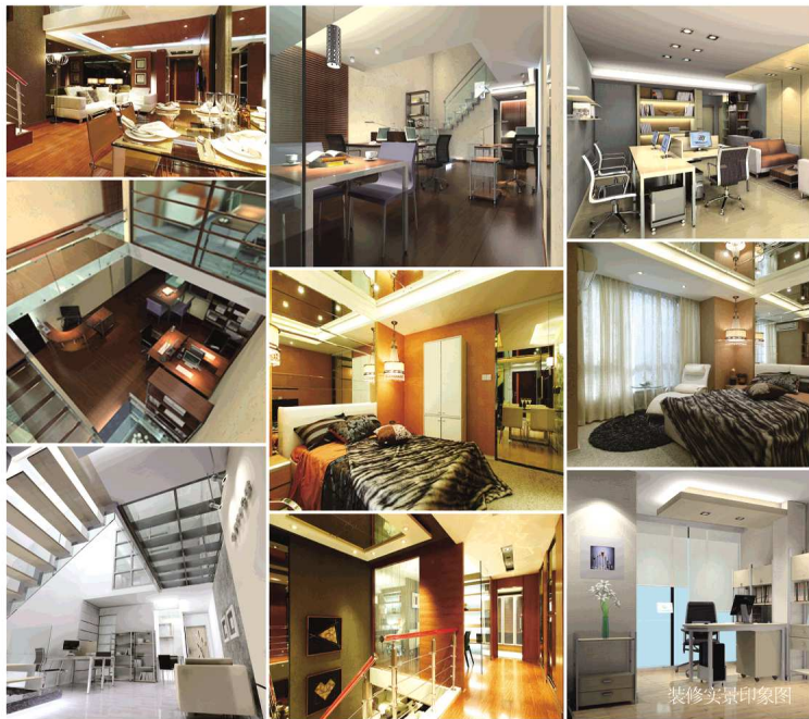
装修效果图印象图