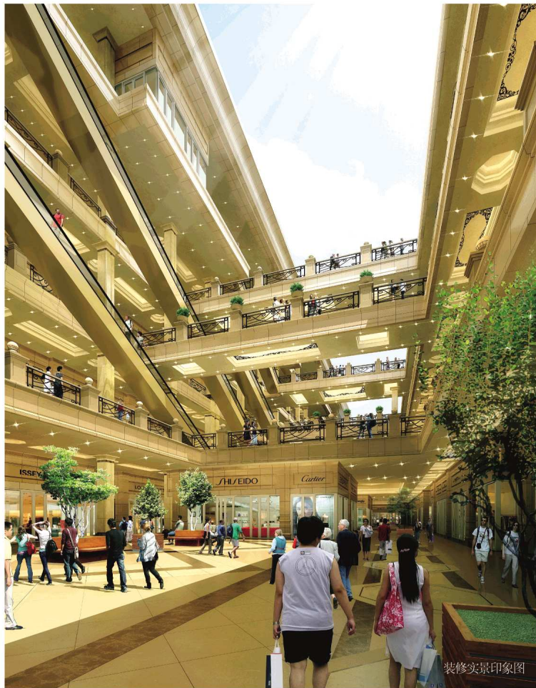
装修效果图印象图

臻罕景观园林: 社区环境以人为本, 生态水景, 花园庭院, 戏水池、景观墙、健身中心、儿童游乐区等俯首皆是, 杨柳依依, 闲庭信步中, 体验四季美景。