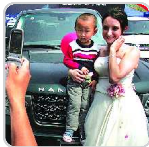
和俄罗斯车模合影留念。