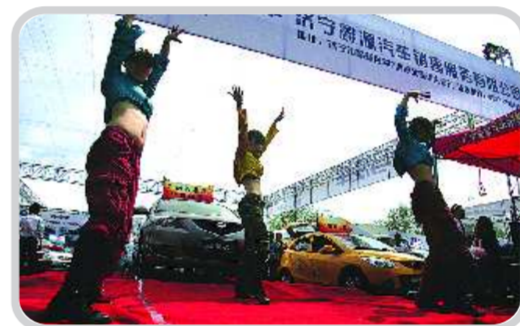
才艺表演为车展助兴。