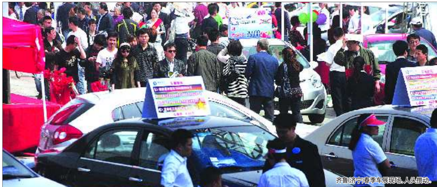
齐鲁(济宁)春季车展现场,人头攒动。

“一边是对于高配置豪车的向往,一边是高油价下养车费用的压力,在众多品牌贴身肉搏的时刻,家庭用户会离他们所期望的性价比无限接近。”一位车商坦言,相比之商务用车,家庭用车是各车商主要争夺的一块市场,毕竟商务用车这块市场是相对平稳的,而家庭用车的销售还是取决于是否迎合了市民的需求,在车展上,降价成了主旋律,也取了招揽客户最有效的手段。