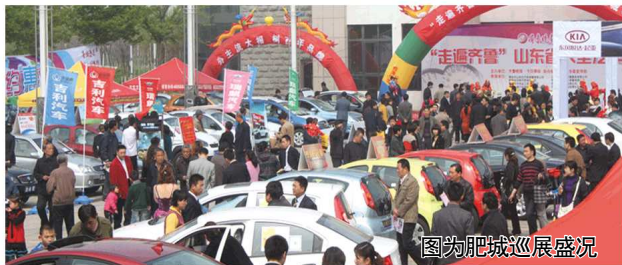
图为肥城巡展盛况

肥城作为巡展活动的“始发站”之一,此次活动共有13个品牌、60余款车型参展。“这样的车展在肥城还是第一次见到,趁着周末过来看看车,在家门口就能购车,很方便”,一位前来购车的当地市民如是说。尽管是户外露天的巡展活动,但各参展商也相当