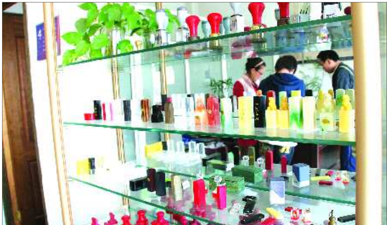
目前,刻章所用的材料种类越来越多。

“现在刻一个公章要上百元,咋这么贵呢?”如今,不少市民在刻章时发现价格变得越来越贵。记者调查济南刻章市场了解到,在电脑刻章的冲击下,传统手工刻章渐渐淡出百姓视野,随着新技术及材料的应用,刻章价格也是水涨船高。