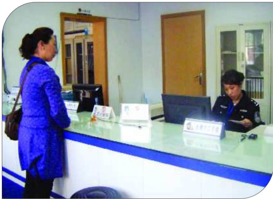
▲一位市民正在办理户口迁移手续。

户口在这个社区,而人却常年居住在另外一个社区或是另外一个城市。在临沂,有一部分人因为怕麻烦,担心被人管而选择人户分离,不及时将户口跟进。但是,记者调查发现,人户分离不仅给公安机关的管理增加了难度,也对社区、计生、民政等部门的工作带来一定困难。对普通居民来说,生育、上学、申请低保等也会受到影响。是什么原因造成了如今的人户分离?人户分离带来了哪些问题?如何才能解决这一难题,记者进行了探访。