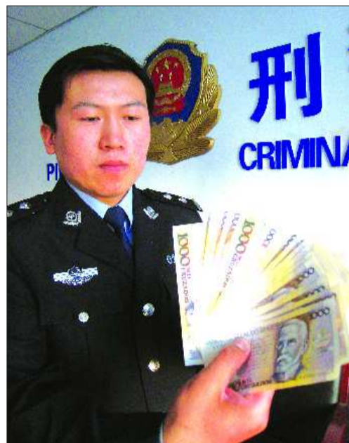
警方展示嫌犯诈骗使用的过期外币。