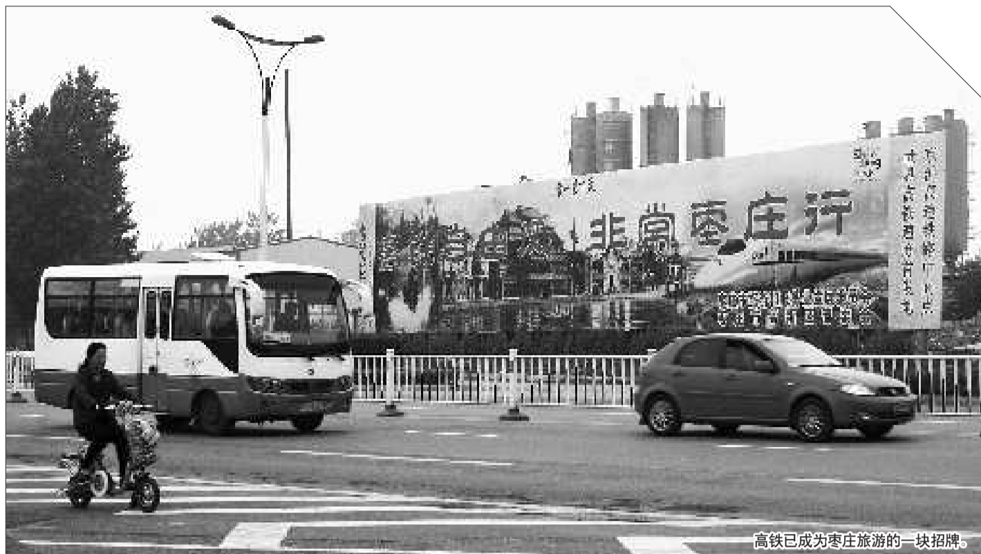
高铁已成为枣庄旅游的一块招牌。

京沪高铁通车后,将给枣庄旅游带来什么?枣庄市旅游与服务业发展委员会相关负责人和专家们纷纷表示,对枣庄来说,京沪高铁就像一块巨大的市场蛋糕,枣庄旅游客源辐射半径将借助京沪高铁的开通大幅扩展,枣庄区位优势 and 旅游优势将借此转化为巨大的现实经济优势。