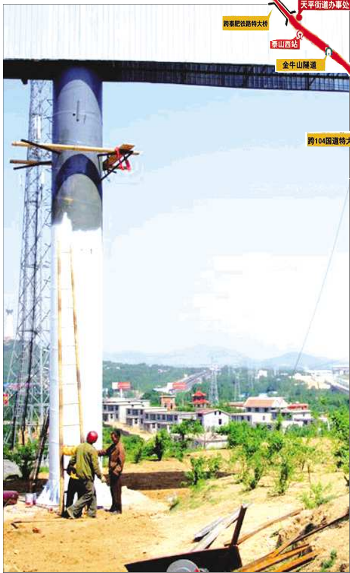
巨大的户外广告牌离高铁近在咫尺。