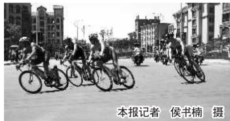
本报记者 侯书楠 摄

本报威海6月11日讯(记者 侯书楠 李彦慧 林丹丹) 11日,国际铁人三项洲际杯赛威海站在半月湾拉开帷幕。加拿大名将琼斯力压群雄,连续三站勇夺男子优秀组冠军。女子优秀组冠军被日本名将庭田清美摘得,中国选手刘婷获得该组季军。