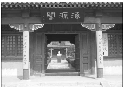
海源阁图书馆