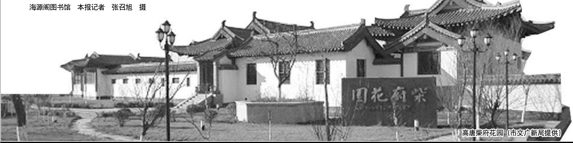
高唐柴府花园

族中人亦不能得见。”老残没能如愿的借到书。他不知道,海源阁藏书皆为珍本、孤本,十分宝贵,不会轻易借人。1975年,中日邦交正常化时,毛主席送给田中角荣的《楚辞集注》就是海源阁藏书的影印本。