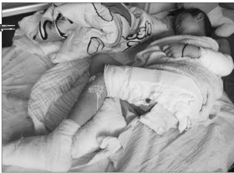
小惠的双脚和臀部严重烧伤。见习记者 马明 摄

孩子的妈妈告诉记者,当时她发现着火的时候,抱起1岁零1个月的儿子,将小惠一把拉起来,告诉她,“孩子,现在着火了,我们要赶快跑出去。跑出去就能活,跑不出去就会死的。”小惠当时紧紧跟在妈妈后面,连鞋子都没穿。“当时我想从旁边的小窗户跑出去,抱着孩子我费了很大的劲,看到小惠出不来,我就使劲拉她。等到我们到火场外面的平台上时,两个台子之间还有一段距离,小惠一下陷了进去。当时我以为小惠爬不上来了,我赶紧过去帮她,结果这个孩子竟然自己爬