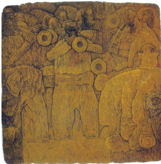
▲厚土 180cm×180cm 1989 (获第七届全国美展铜奖)

明、徐培范阐释的很清楚:“我们认为,对两个矛盾世界的根源的探究,恐怕唯有从赵建成身上生存的和文化的两端来追寻。作为生存者,他经历过人生的坎坎坷坷,既已承受过这艰难的一页,当然需要抒发与倾诉,需要心灵的释放与平衡,于是就构成了第一个世界的情感基因。同时,作为文化人的他,又受着传统文人画的影响和种种现代哲学艺术思潮的诱惑,与本性中渴求宁静舒然的心态融为一体,日趋空灵与超然,这就构成了第二个世界的悟性基础。”