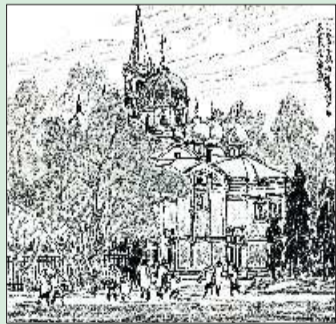
▲俄罗斯教堂 26.5cmx25cm 1995