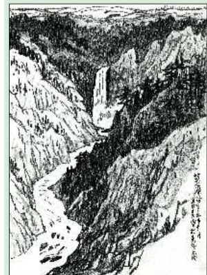
▲黄石瀑布 20.5cmx28cm 2005