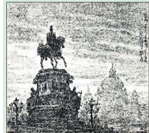
▲尼古拉一世铜像 20.5cmx23.5cm 1997