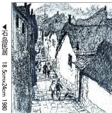
▲石岛民居 18.5cmx24cm 1980