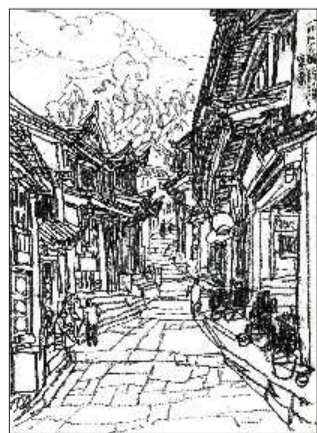
▲丽江古城 21cmx28cm 2009