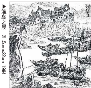
▲渔岛之晨 21.5cmx22cm 1984

从传统意义上来看,速写是认识生活、搜集素材、记录形象的主要手段,是艺术创作的基础,但是它本身作为可独立欣赏的艺术品,从素材积累进入到艺术创作的过程常被我们忽略。丁宁原先生的每一幅速写作品都可以称得上是很好的艺术品,这在于他按照自己的艺术观念、艺术思想进一步消化所见所感,不是看到什么就画什么,而是进入一种思考、处理的境地,进行有效的概括、取舍、归纳、强化,在速写的过程中找到属于自己艺术创作的语言方法,从而使作品独具个性。丁宁原先生的速写作品,线条流利顺畅,下笔肯定,具有强烈的节奏感;通过疏密处理和黑白灰色调的搭配,构成画面层次分明的对比关系。每一幅作品都具有完整的构图、层次、节奏,说明他在取景时