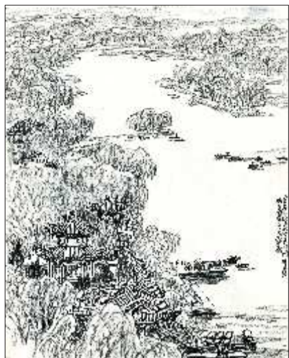
▲大明湖 25.5cmx31.5cm 2005