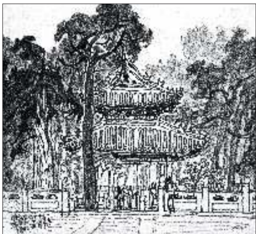
▲孔庙杏林 23.5cmx21cm 1983