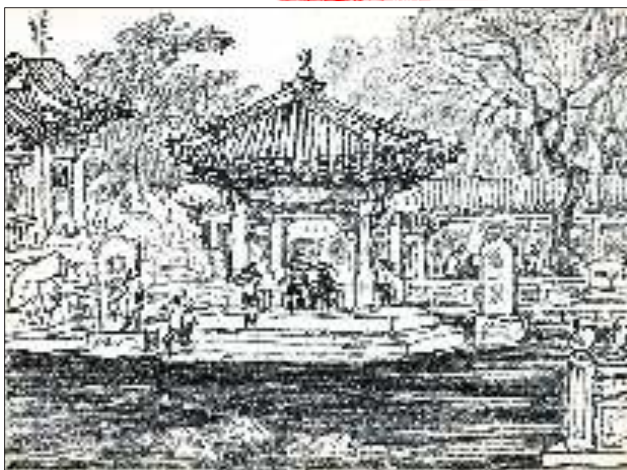
▲趵突泉·观澜亭 28cmx21cm 2009