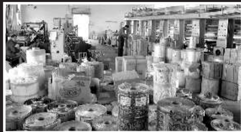
假商标印制车间。