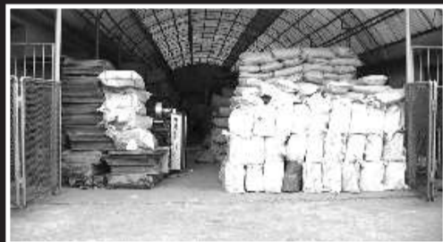
查扣的部分原料和设备。

10元一斤的大包粉,经过他们的加工,贴上假商标就成了“贝因美”、“飞鹤”等名牌奶粉,每包奶粉的价格骤然上升一倍。去年11月份以来,莱阳警方连续奋战200天,行程8万多公里,成功将一个集制版、印刷、生产、运输、销售于一体,假冒8个品牌22个品种奶粉的特大假冒注册商标犯罪团伙一网打尽,抓获涉案犯罪嫌疑人32名,捣毁印刷、加工、储藏黑窝点22处,查扣制假机械设备31台套,查扣假冒奶粉的成品、半成品30余吨,查扣假冒商标标识400余万枚,初步查明涉案总价值1100余万元。截至7月初,莱阳警方已向检方移送26名犯罪嫌疑人。