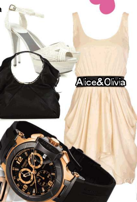
Alice &amp; Olivia