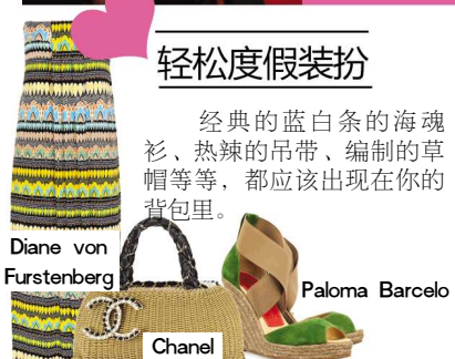
Diane von Furstenberg