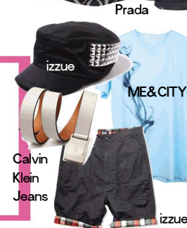
Calvin Klein Jeans