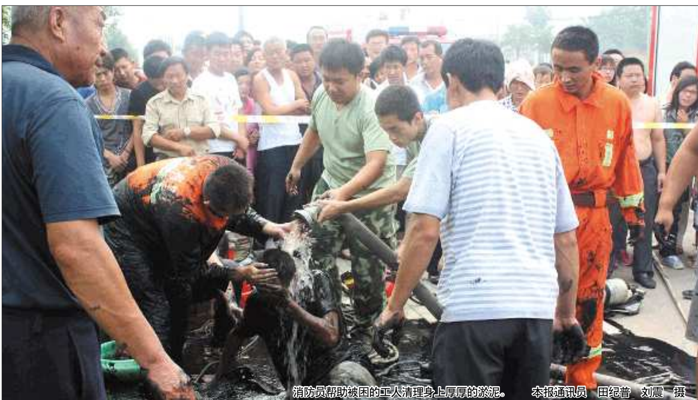
消防员帮助被困的工人清理身上厚厚的淤泥。