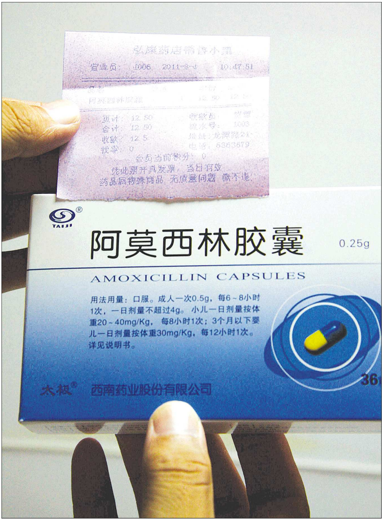
记者在没有拿到医师处方的情况下从药店买到了处方药。