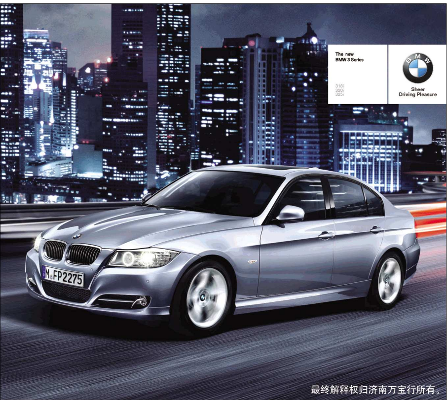
最终解释权归济南万宝行所有。

而对于药店违规出售处方药的现象,工作人员表示,相关规定只能对药店有作用,但对市民却没有约束力,希望更多的市民从自身做起,提高意识。在购买处方药时,一定要医师出具处方。