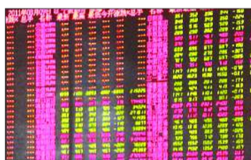
一证券交易厅内,几位股民正在讨论行情。

而9日沪深两市上演了一场惊心动魄的绝地反击。截至收盘,沪综指收报2526.07点,微跌0.747点,几近收平于上日,深成指小幅微涨,在哀鸿一地的亚洲成为中流砥柱。