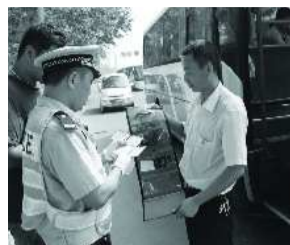
四方交警检查客运车辆证件。

本报8月10日讯(通讯员 陈刚 梁心龙 记者 赵壁) 10日,交警部门在青岛全市范围内开展了道路客运隐患整治统一行动,查处交通违法行为9000余起,其中超速行为达到2000余起,酒后驾驶行为6起。