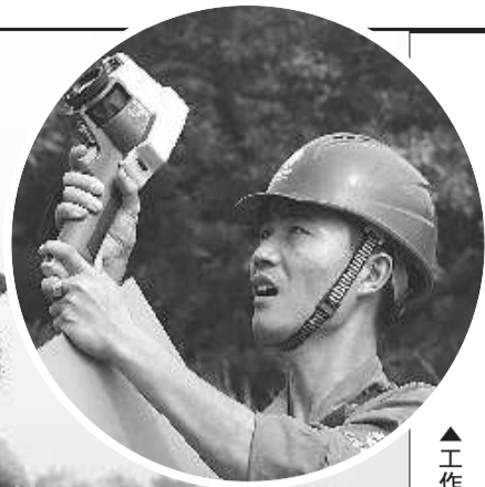
▲工作人员用红外测温仪测量高压电线导线接头的温度。

检查完3个输电铁塔已是下午5点,约走过了七八里山路。这一段路还只是他们一天正常工作的一部分。据了解,全市共有30多名运检班队员,负责维护总长1300多公里的高压线路。在炎炎夏日里,这些运检班队员只是供电公司一线队伍的一个缩影,更多岗位的员工正坚守在一线,确保着全市每天约195万千瓦时的用电量。