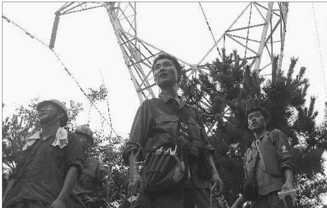
▲检修完一个输线铁塔,他们又向另一个“高地”眺望,前方路途遥远,他们依旧充满信心。