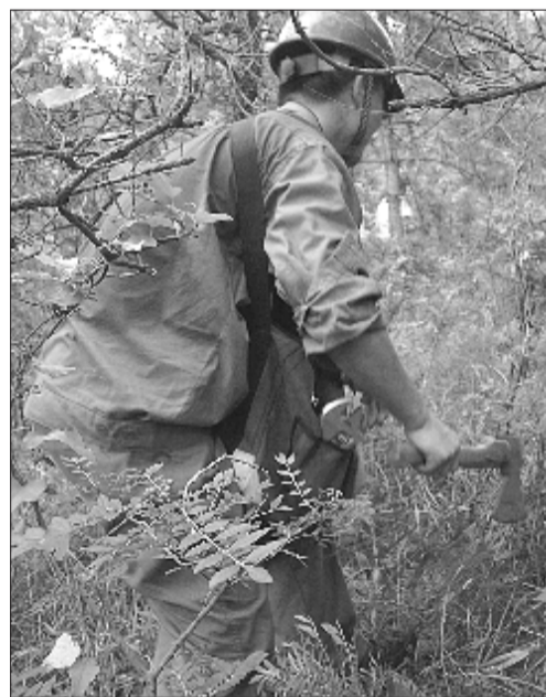
▲山路崎岖难走,杂草已经挡住了道路,工作人员用斧头在前面开路。