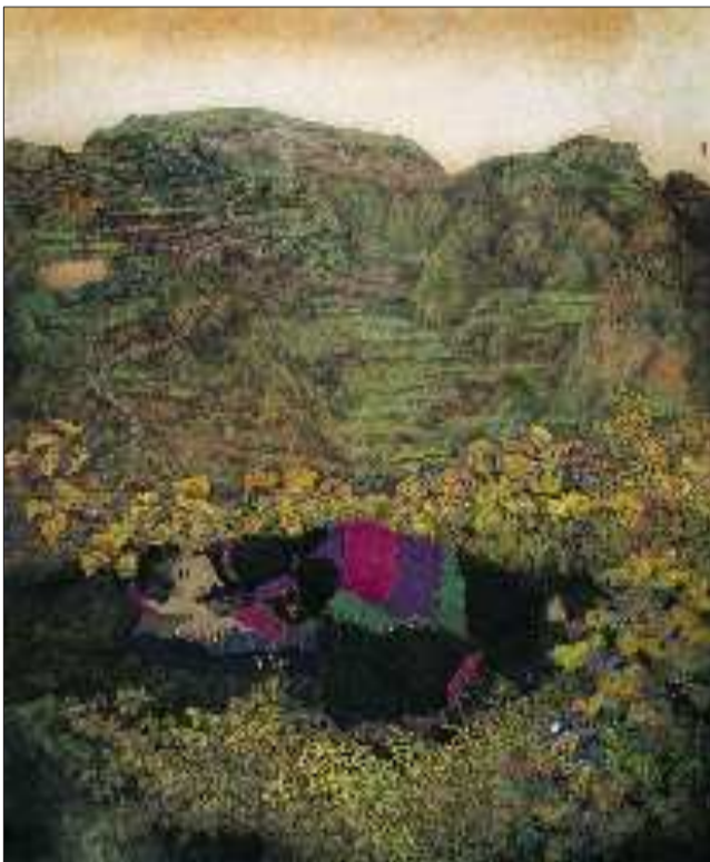
聆听风吟 160cm×138cm 于文江

中国的工笔画历史悠久,是中国视觉艺术中出现较早、流传久远的艺术门类。工笔画精描细绘,使用“尽其精微”的手法,通过“取神得形,以线立形,以形达意”来获取神态与形体的完美统一。在20世纪80年代中西方文化交流的大背景下,工笔画作为中国视觉艺术中出现较早、流传久远的艺术门类,在风格样式、艺术表现手法、表现形式的拓展与创新中出现了新的面貌。中国工