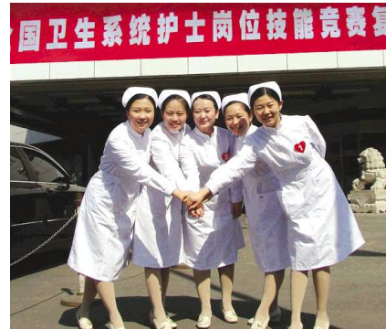
山大二院护理团队获得全国卫生系统护士岗位技能竞赛金奖