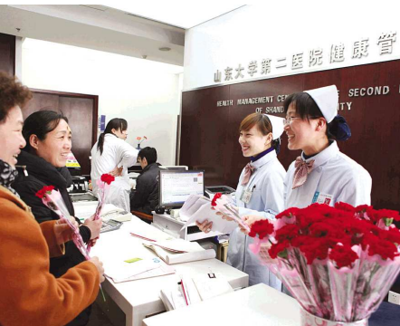
健康管理中心工作人员提供热情的服务