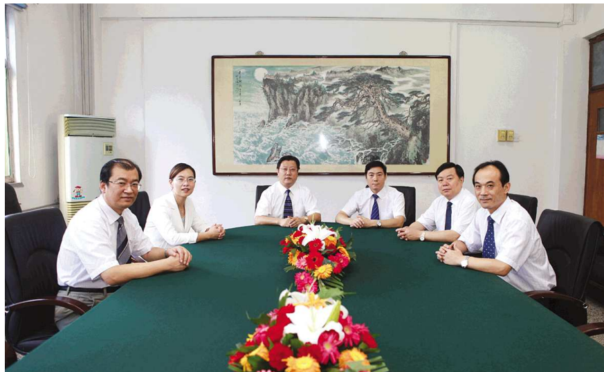
医院领导班子合影

更让患者感动的,是闪耀于精湛的医疗技术之中的医道仁心与亲情。医院高度重视职工道德教育,医德医风建设是医院工作的重要支撑。从山东省首家向社会公开承诺建设“无红包医院”,到5.12抗震救灾和支援北川灾后重建的现场,从抢救四