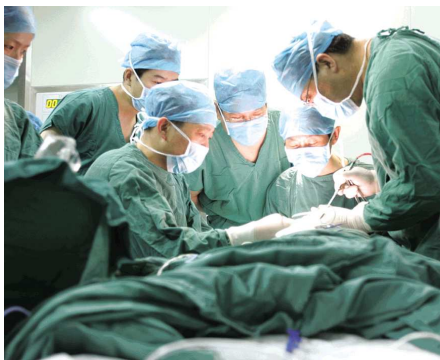
不断提升医疗质量是山大二院发展的核心