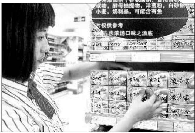
一些超市仍在销售争议“浓汤宝”。(大图) 说明标有“可能含有鱼”字样。(小图)

济宁济州律师事务所律师认为，根据《食品安全法》规定，生产商应对生产的产品成分、含量作出明确说明，不能使用含糊不清的用词。同样，消费者有知情权，可以要求生产商明确说明产品含量成分。否则，就是违反《产品质量法》和《食品安全法》的行为，监督管理部门有权责令改正。