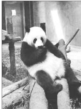
成都大熊猫繁育基地

在成都问当地人,成都最值得去的地方是哪里?常常会听到:西蜀第一街——锦里呀!历时三年打造的有“成都版清明上河图”之称的锦里与2004年11月1日正式开市,对各地游客开放。虽然锦里跟武侯祠连为一体,但进入锦里是不需要买门票的。这是一条集中展示巴蜀民俗和三国蜀汉文化的民俗风情街,锦里民俗休闲街位于四川省成都市武侯祠旁,是成都市首座以传统川西古镇为建筑风格的旅游休闲街区。 街区全长350余米,有茶坊、客栈、酒楼、酒吧、戏台、各种风味小吃、工艺品、土特产等等,集旅游购物、休闲娱乐为一体,不仅是人们怀旧寻梦的好去处,其在深厚民俗文化根基上营造出的休闲气氛更值得您细细回味。