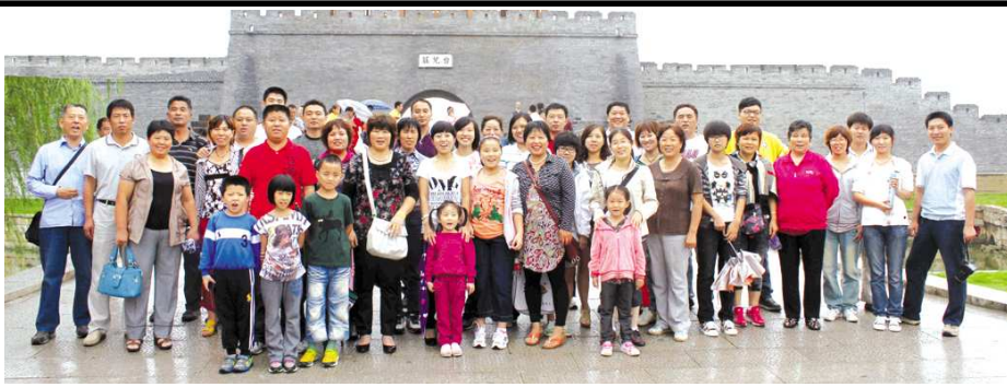
◎齐鲁逍遥自驾游游记