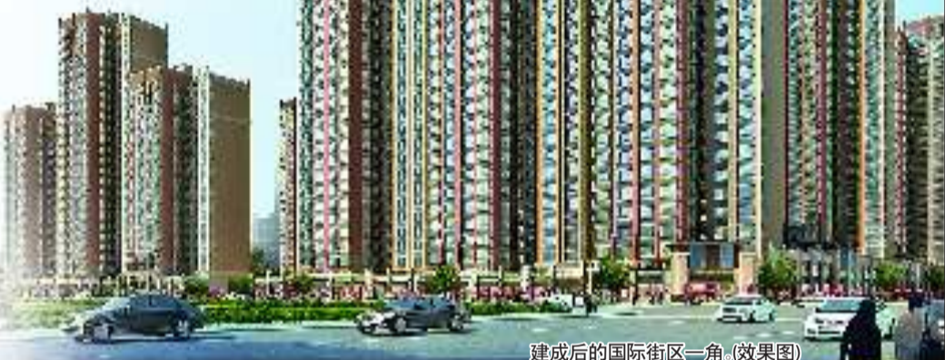
建成后的国际街区一角。(效果图)