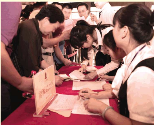
房源确认成功，终于选到了心仪的房子！

仅隔28天，8月20日南益·名泉春晓2号楼盛大开盘，再现抢购热潮，累计狂销6亿。住宅组团2号楼，北临情景商业街，购物休闲一步到位，南面双中心景观，俯仰万千胜景。前街后园的至尊居住享受，错过再难求！