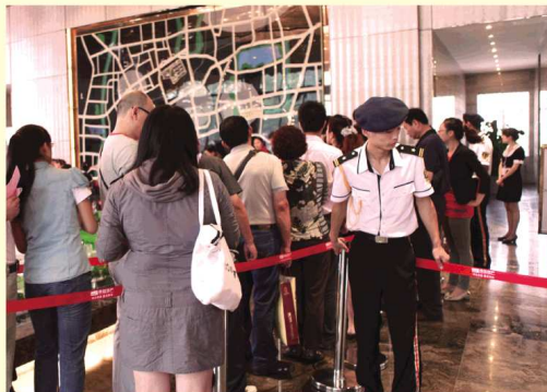
排队等待的客户盼望着能选到心仪的房子