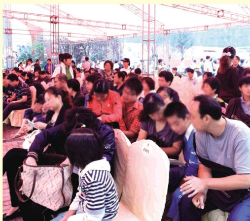
选房等候区的客户们热情讨论着要买的房子

南益·名泉春晓，在济南首创55万㎡国际新街区，与国际都会接轨，一改传统社区零散分布和功能设置单一的局面，引进集住宅、办公、公寓、购物、休闲等众多功能于一体的一站式生活模式。其核心是将居住和商业更好地融合，以满足社区及周边居民个性化的消费为根本，全面提升居民的生活品质，并通过多元业态辐射全市及周边市区。远见城市未来发展，偏爱优越城市生活！