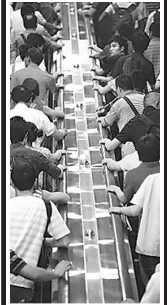
市民购物时乘坐电梯。(资料图)