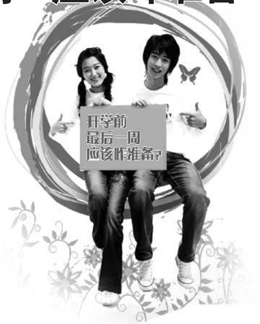
编辑:王鲁娜 组版:郭冬梅