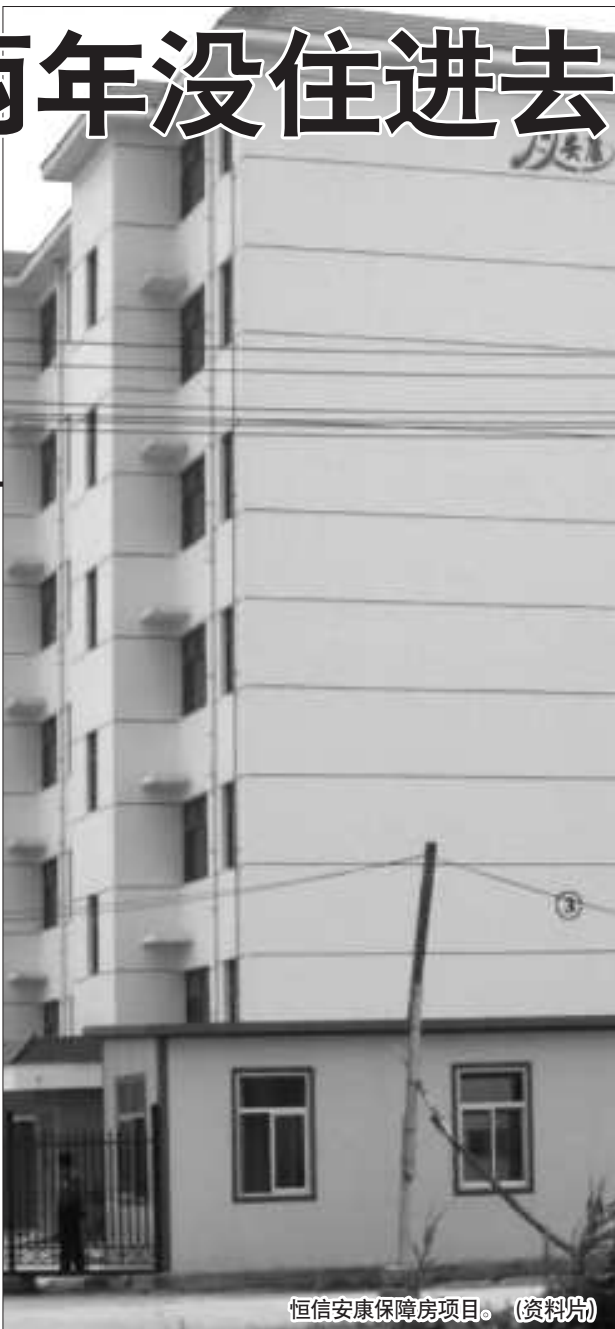
恒信安康保障房项目。(资料片)

据物价局工作人员说,由于具体楼层具体的单价需由开发商自己商定,然后汇报给物价局以及房管局,但是到现在为止一直没有接到开发商拿的汇报价格,所以这就导致经适房到现在为止一直不能摇号分配。