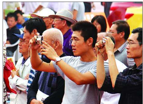
靓车美女吸引着人们的相机快门。