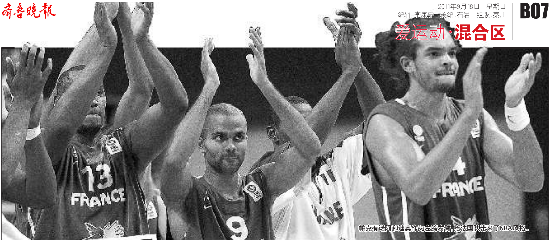
帕克有诺阿和迪奥作为左膀右臂,给法国队带来了NBA风格。