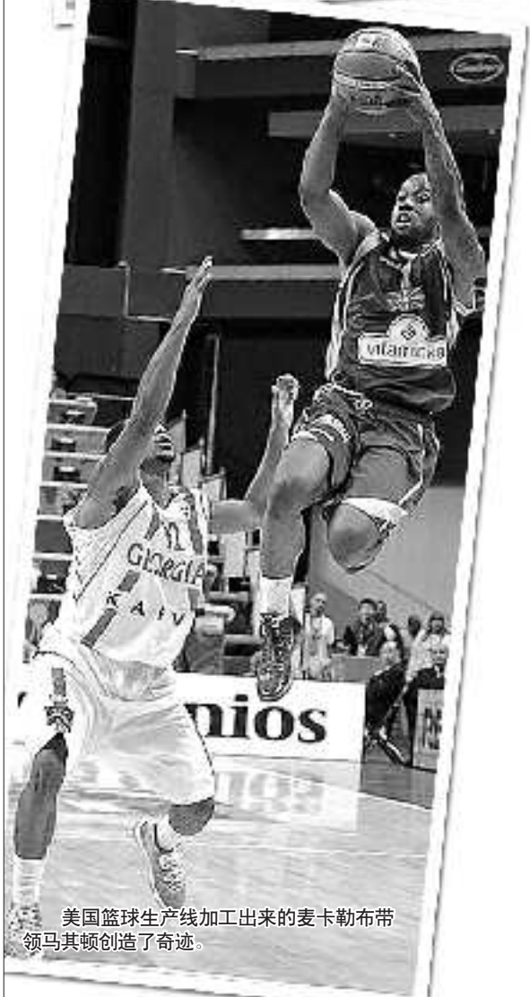
美国篮球生产线加工出来的麦卡勒布带领马其顿创造了奇迹。