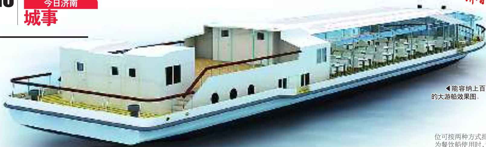
◀能容纳上百人的大游船效果图。