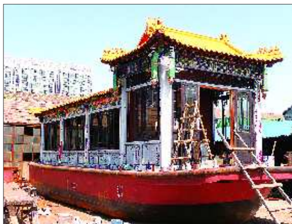
正在改造的小画舫。

十一期间,小清河将蓄水通航,届时六艘船将在河上欢畅航行。这些游船是啥样子?21日,本报记者对此进行了探访。