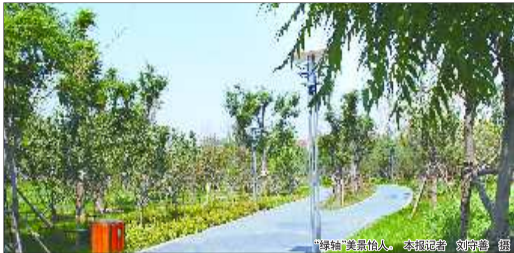
“绿轴”美景怡人。

本报济宁9月26日讯(记者 刘守善) 位于济宁科技新城中轴线上的“绿轴工程”,经过半年多的施工建设,目前已基本完工,进入收尾工作。记者26日探访“绿轴”看到,草坪、大树组成一幅幅生动灵气的画卷,绿意尽显。